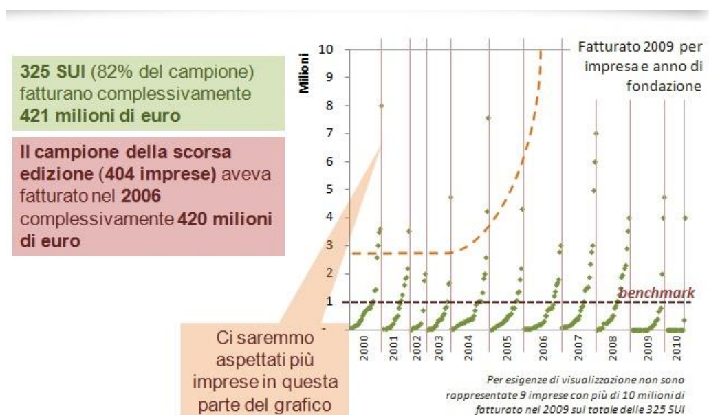
Figura 2 - Start up innovative nate in Piemonte per anno di nascita e fatturato nel 2009

5. La crisi ha inciso selettivamente sulle SUI. Le SUI esportatrici (quasi esclusivamente benchmark) sono cresciute del 40 per cento prima della crisi (2006-09) e del 12 per cento dopo la crisi (2009-10). Le SUI non esportatrici sono cresciute del 29% prima della crisi (06-09) e del -2 per cento dopo (09-10). Il 27,3 per cento delle SUI ha dovuto, a causa della crisi, rivedere e ritardare i propri piani di investimento.