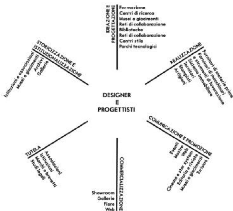
Figura 1 – La filiera del design

Preposti a tali funzioni, a Torino troviamo, tra gli altri, il MIAAO - Museo Internazionale delle Arti Applicate Oggi, nato nel 2006, il Museo del Design GH di None Torinese, inaugurato nel 2008 e subito inserito nel circuito di Torino WDC, oltre al “nuovo” Museo nazionale dell’Automobile, luogo iconico del rapporto dialettico tra conservazione e promozione del design, e innovazione tecnologica e di prodotto.