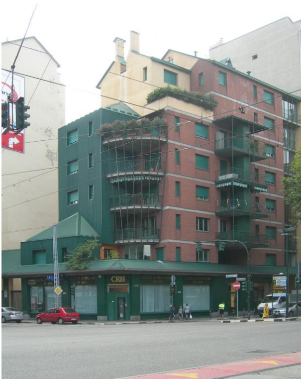
Piazza Bengasi n° 16

Considerato che la città è stata investita da una trasformazione dal carattere epocale, ora che i “giochi sono fatti”, che le olimpiadi e suoi effetti sono alle spalle e che sono passati 20 anni di applicazione del piano regolatore sembra arrivato il momento di domandarsi quale sia stato il valore realmente “internazionale” delle procedure strategiche messe in atto, quale l’innovazione nei modelli di sviluppo proposti, quale la ricaduta sull’ingiustizia distributiva che affligge la città, quali le risposte sul piano della qualità ambientale e della qualità architettonica. Così come sembra giusto domandarsi se sia stata prestata la necessaria attenzione all’esito delle operazioni intese come azioni rivolte alla costruzione di valori identitari, azioni capaci cioè di rappresentare la vita individuale e sociale, di depositare valenze simboliche e di senso, e quindi di esplicitare le ragioni di una civiltà 21 . Occorre anche verificare se in questa spasmodica ricerca di cambiamento di immagine sia stato analizzato il valore degli elementi identitari. Qual è il legame fra la nuova immagine di Torino ed i caratteri propri della nostra città, della nostra cultura? Quali sono le relazioni fra una cultura specificatamente architettonica presente sul territorio e la nuova immagine di Torino non più relegata nel semplice ruolo di company town ?