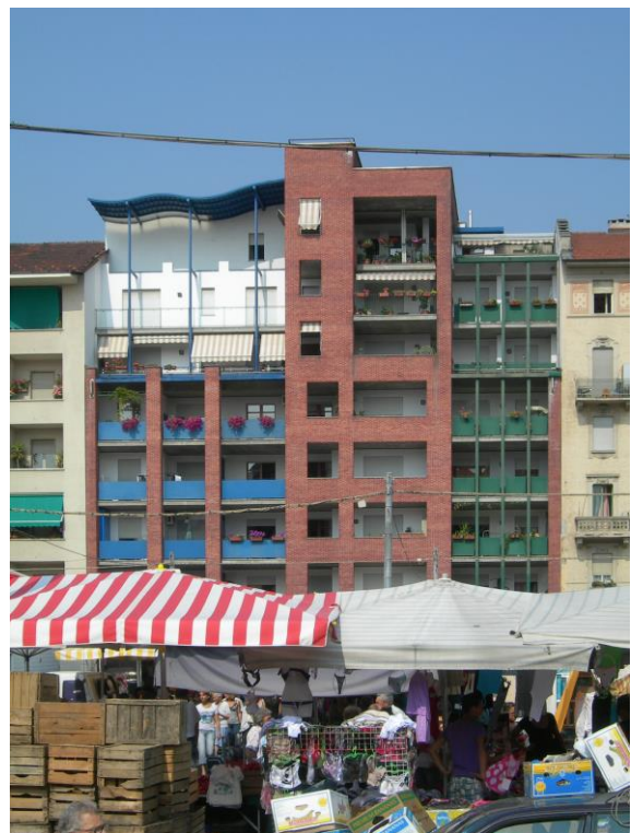
Corso Unione Sovietica n° 153